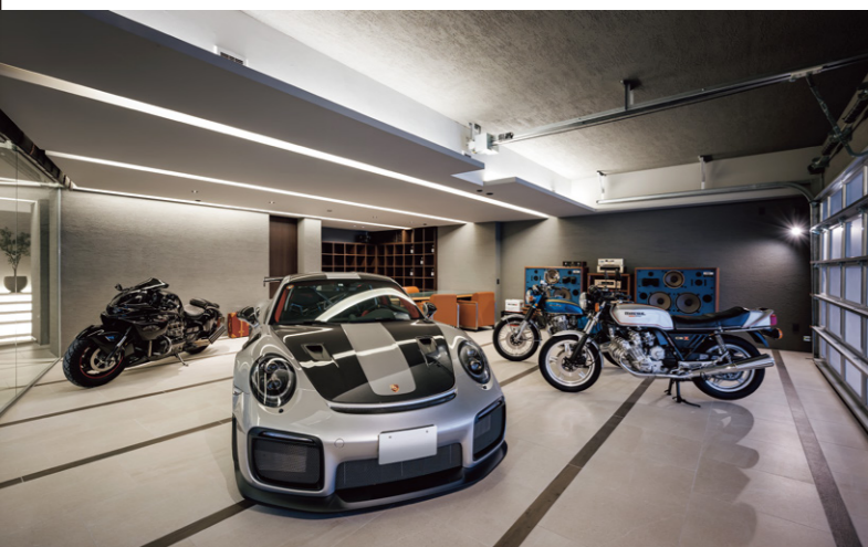
ゲストと心ゆくまで語り合う地下空間