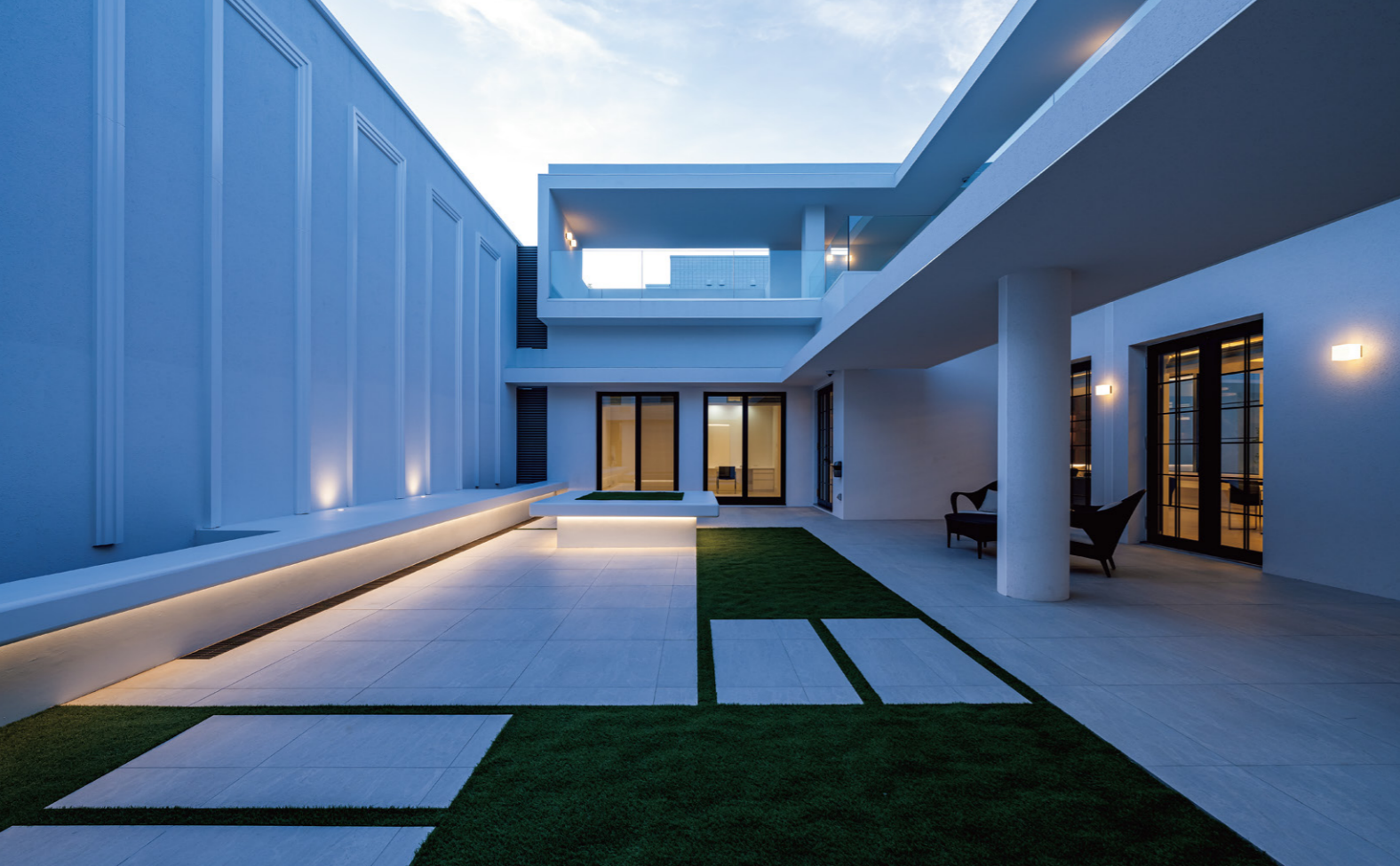
白で統一された中庭のデザイン。直線の庇、床板が印象的だ