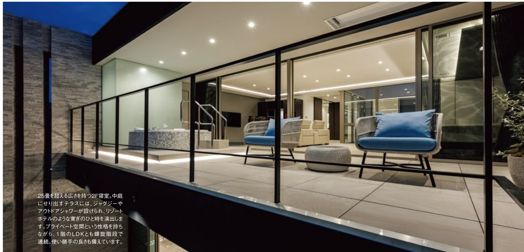
25畳を超える広さを持つ2F寝室。中庭にせり出すテラスには、ジャグジーやアウトドアシャワーが設けられ、リゾートホテルのような寛ぎのひと時を演出します。プライベート空間という性格を持ちながら、1階のLDKとも螺旋階段で連続。使い勝手の良さも備えています。