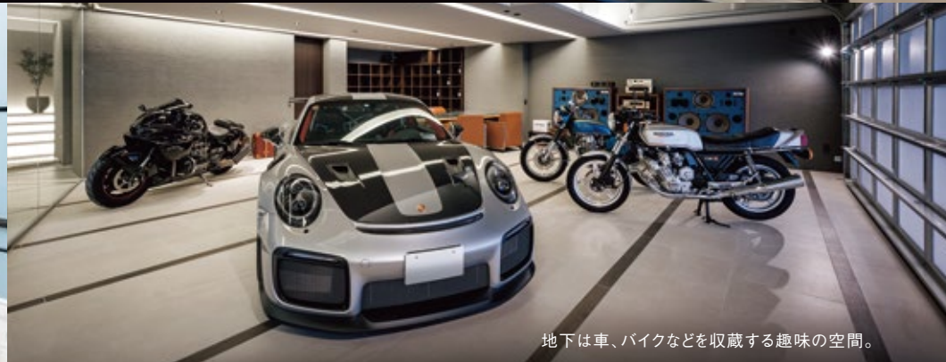
地下は車、バイクなどを収蔵する趣味の空間。