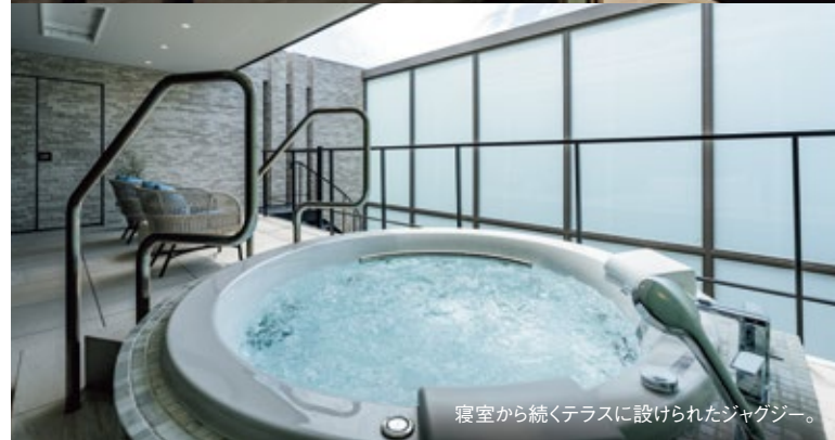
寝室から続くテラスに設けられたジャグジー。