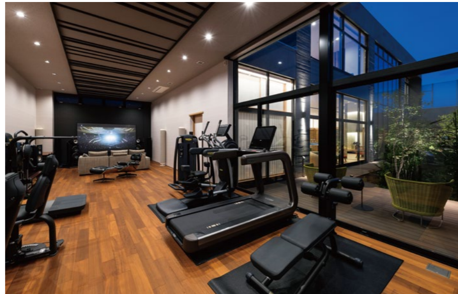
機能性とデザインを選りすぐったトレーニングマシンが引き立つジムスペース。奥にはオーディオルームを兼ねた書斎。