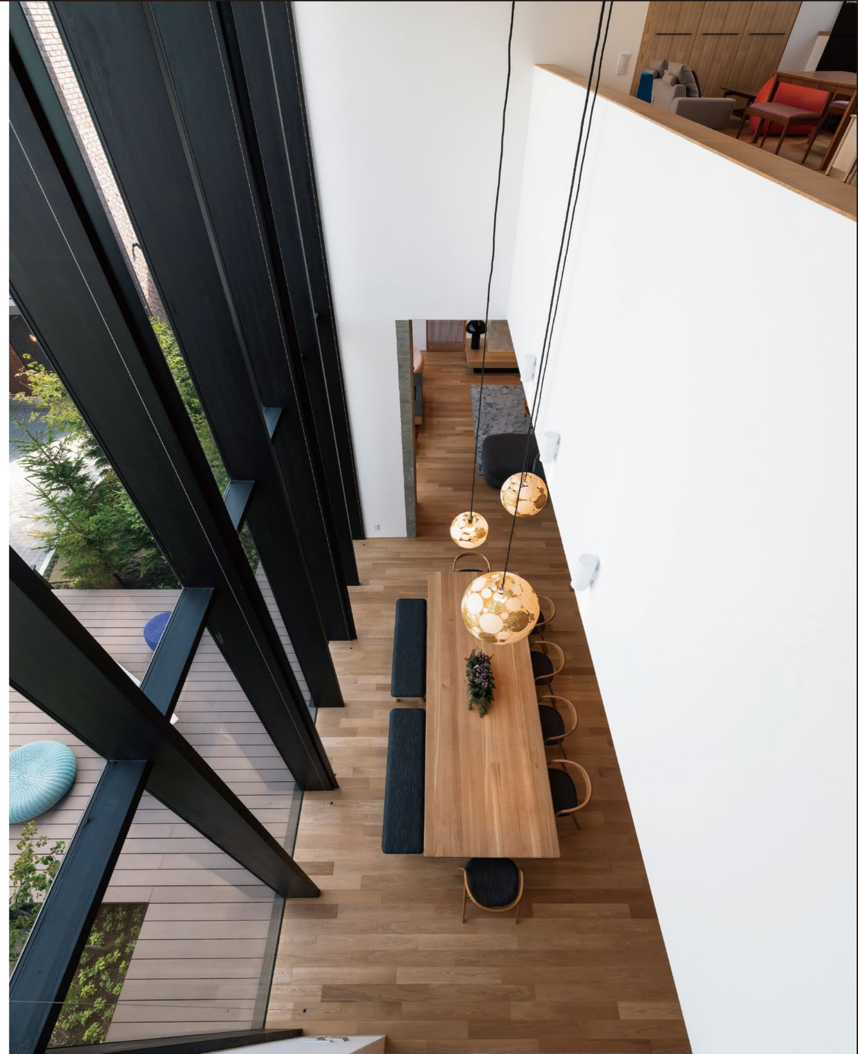
吹抜けの天井まで届く大きなガラス窓。縦に伸びる格子がさらに高さを感じさせて、爽快感を演出する。