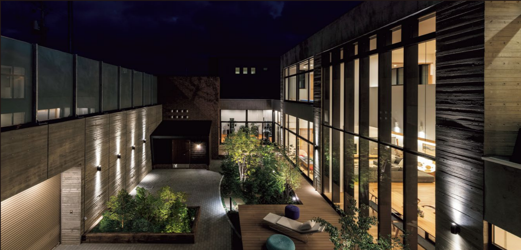
主要な窓はすべて中庭に面するように部屋を配置し、広さと流れを作る。