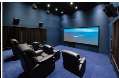
設計段階から専門家が加わり、音響にこだわり抜いた、映画館グレードのシアタールーム。