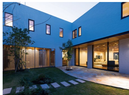
近隣と距離が近い分、外壁を高くすることでプライバシーを確保。家中どこにいても、広い中庭からたっぷりと陽光が入り、空と風を感じられる。