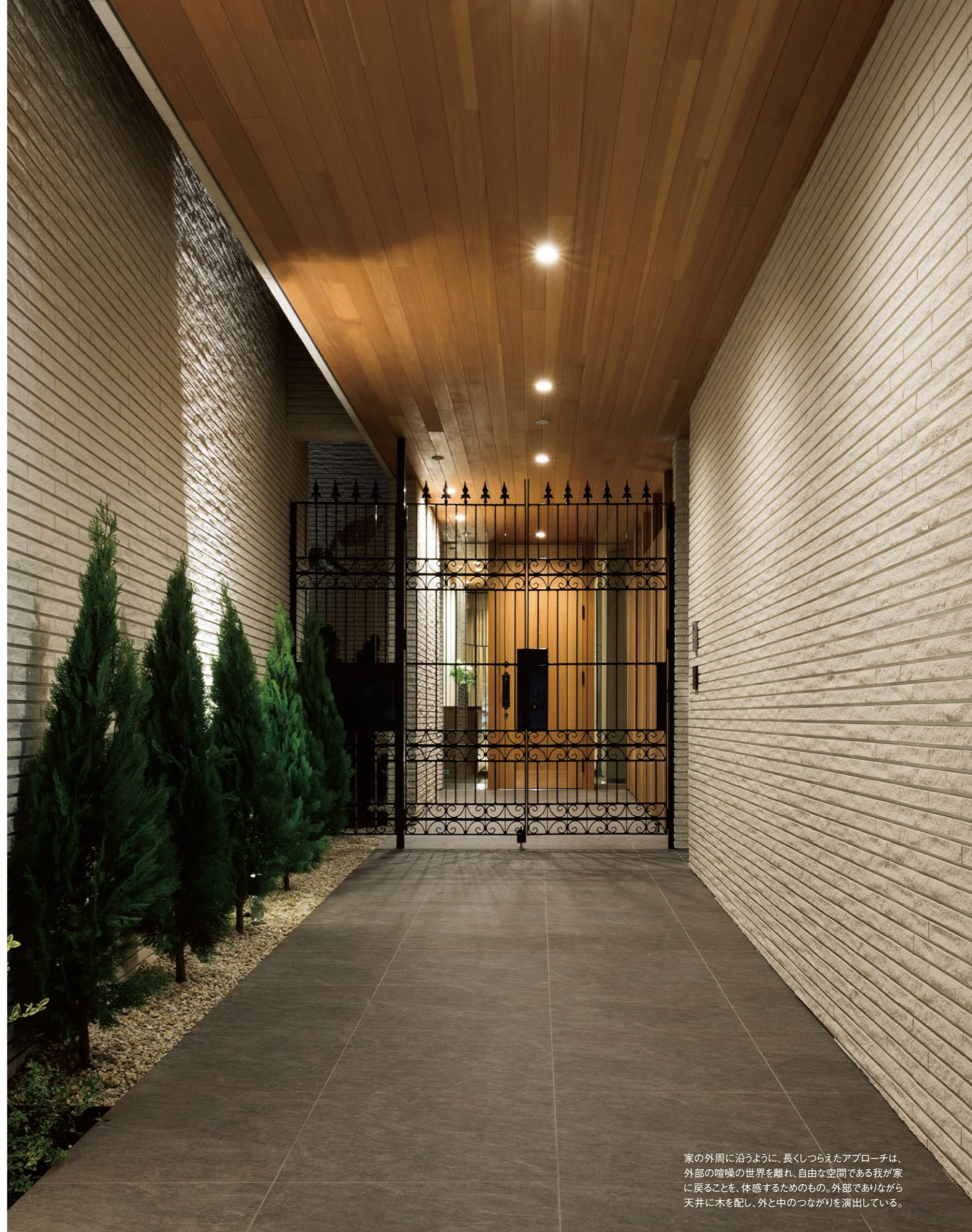
家の外周に沿うように、長くしつらえたアプローチは、外部の喧噪の世界を離れ、自由な空間である我が家に戻ることを、体感するためのもの。外部でありながら天井に木を配し、外と中のつながりを演出している。