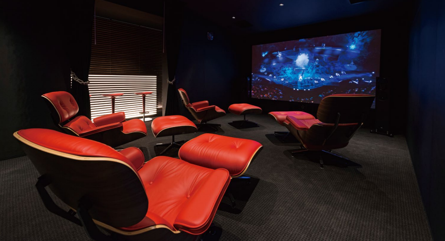
家族や気の置けない友人たちと、大好きな映画や音楽を楽しむシアタールームには、バーカウンターも配置。好きなものに囲まれて、心を遊ばせる。