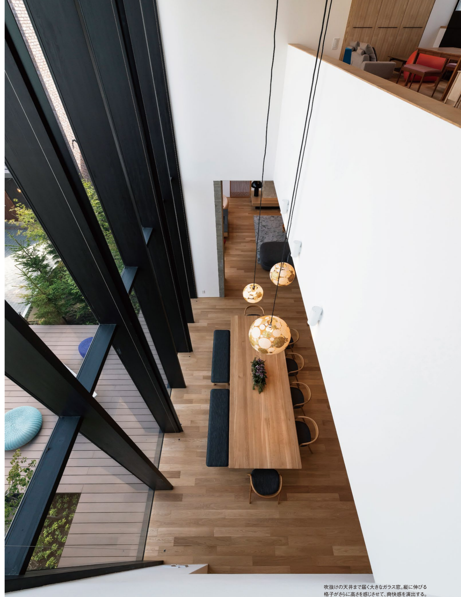
吹抜けの天井まで届く大きなガラス窓。縦に伸びる格子がさらに高さを感じさせて、爽快感を演出する。