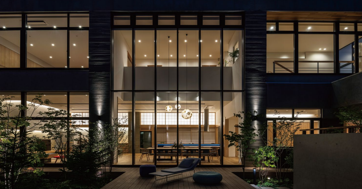
夜のとぼりが降りると、屋内の景色は一幅の絵画のように美しく浮かび上がる。