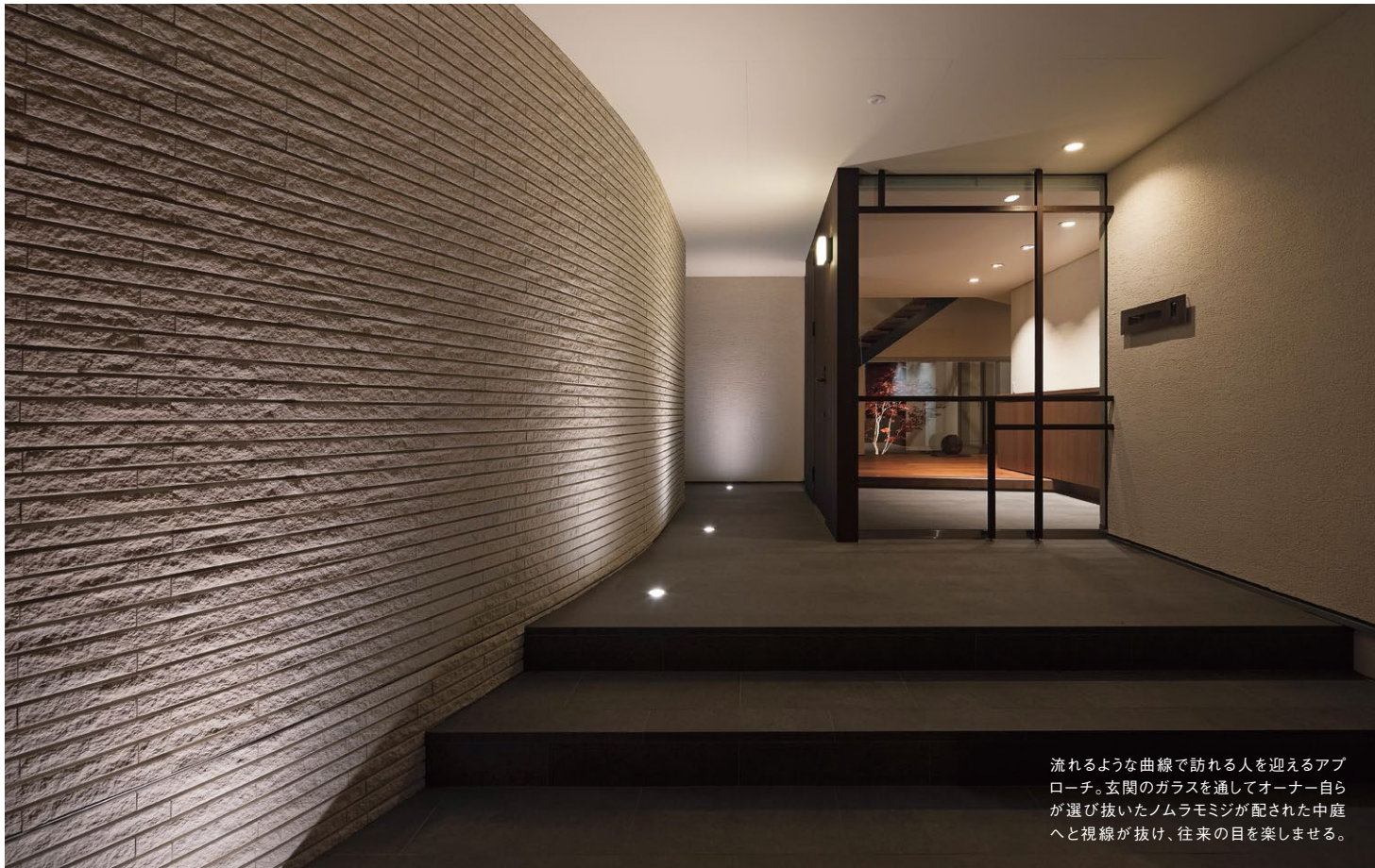
流れるような曲線で訪れる人を迎えるアプローチ。玄関のガラスを通してオーナー自らが選び抜いたノムラモミジが配された中庭へと視線が抜け、往來の目を楽しませる。