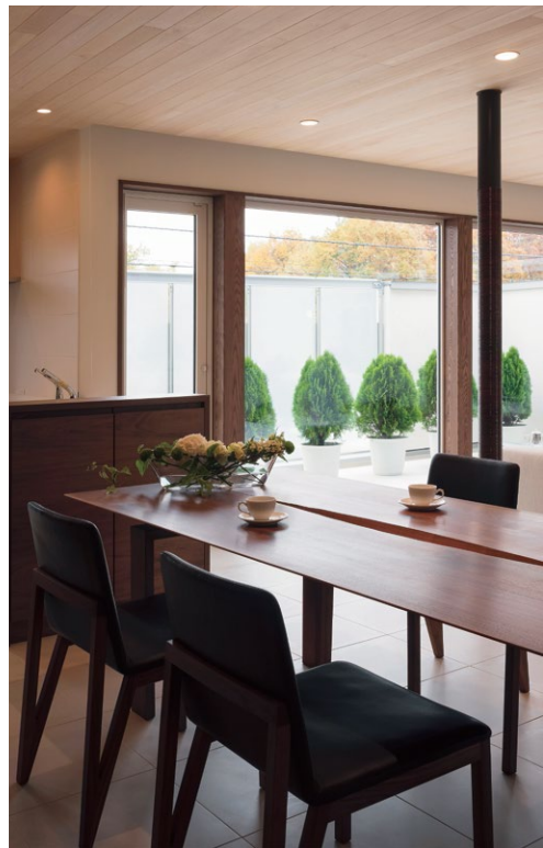
リビングと連続して設けられたダイニングからもバルコニーを見渡すことができる。ウォールナットで仕上げられたテーブルの色合いが床の白タイルに映える。